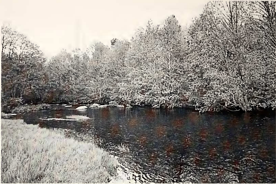
Figura 4. Fotografía del río Águeda en la estación de muestreo Ag-5 (El Potril, Fuenteguinaldo). Figure 4. Águeda River. Locality Ag-5 (El Potril, Fuenteguinaldo)

ejemplares vivos aislados hacen necesario acometer una serie de medidas compensatorias dentro del Programa de Vigilancia Ambiental. Las medidas de conservación propuestas para la población recién descubierta serían las siguientes: